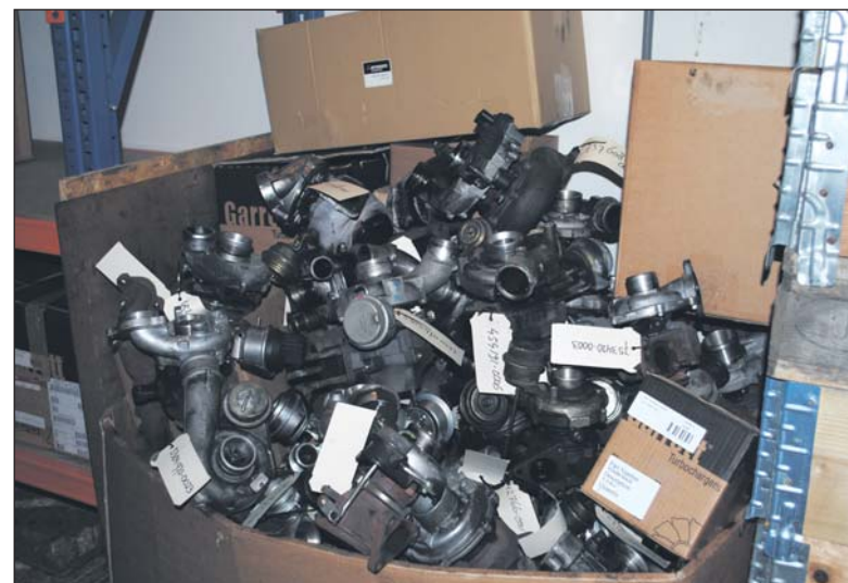
Een teruggestuurde turbo kan voordeel opleveren.