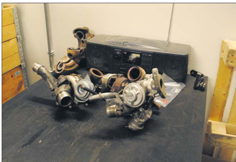
Een dubbele turbo uit een Peugeot 407.