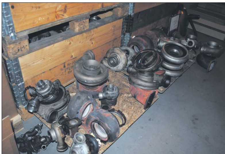
Twintig procent van de leveringen gaat naar industriële en maritieme klanten.

Een teruggestuurde turbo kan echter wel voordeel opleveren. Er wordt geen statiegeld berekend. Transportkosten voor een nieuwe turbo komen op rekening van Turbo Direct. Bestellingen die voor half zes geplaatst worden, worden indien voorradig, dezelfde dag nog verstuurd.